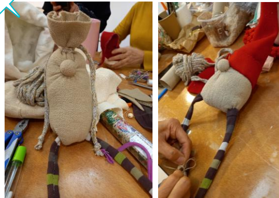
Assembler le gnome