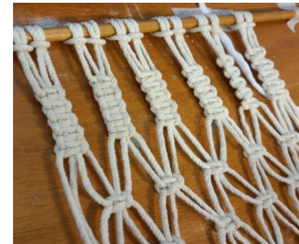
Avec de la ficelle