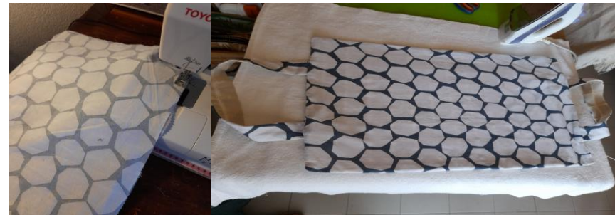
5. Assemblage du sac

Epingler la poche de 28cm en pliant un bord de 0,5 cm à l'intérieur et la coudre sur l'endroit de la doublure,