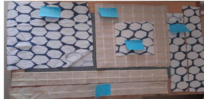
2. Mesure et découpe