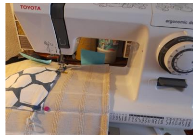
4. Assemblage de la poche

Coudre une bande de tissu épais (65cm sur 8 cm) avec un bande de tissu fin, endroit contre endroit à 0,5 cm du bord pour chaque poignée.