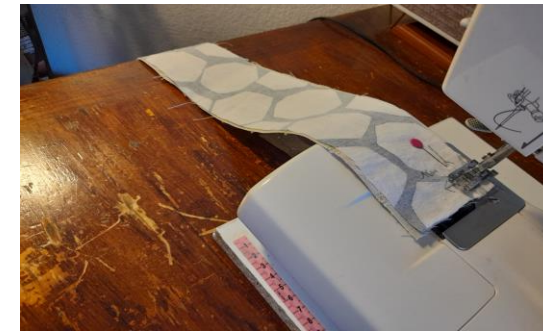
3. Repassage et assemblage des poignées

Coudre une bande de tissu épais (65cm sur 8 cm) avec un bande de tissu fin, endroit contre endroit à 0,5 cm du bord pour chaque poignée.