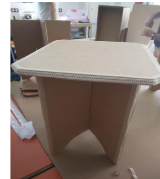
7. Poser les bandes de kraft sur les bords pour la finition en les humectant avec une éponge bien imbibée d'eau.