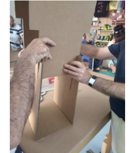
4. Encastrer les parties de la base du tabouret dans la fente