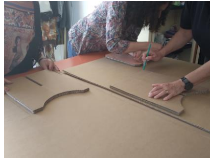
1. Tracer les gabarits sur le carton