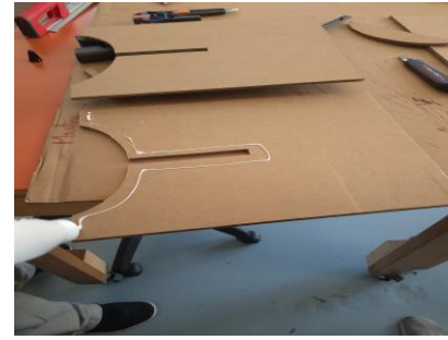
2. Découper les différents morceaux en suivant les traits avec le cutter