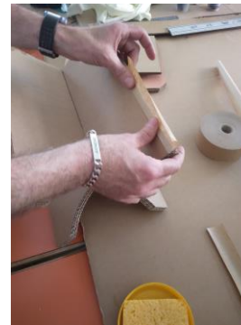
6. Poser le socle sur l'assise