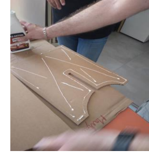
3. Coller avec la colle à bois les parties entre elles pour les doubler