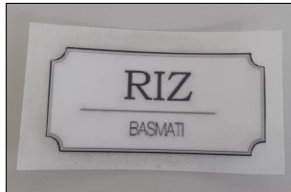
4. Découper le tout à la taille d’étiquette souhaité