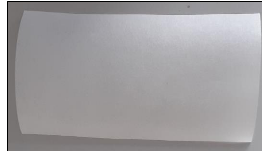
2. Découper un morceau de papier sulfurisé