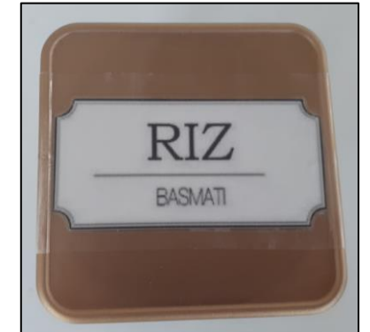
6. Puis coller l’étiquette