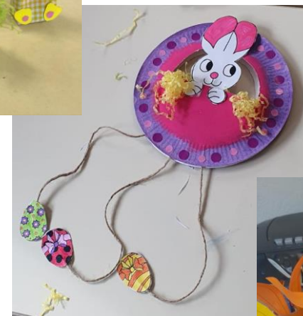
Chutes de papier