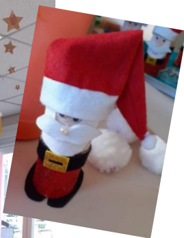
Rouleaux de papier toilette