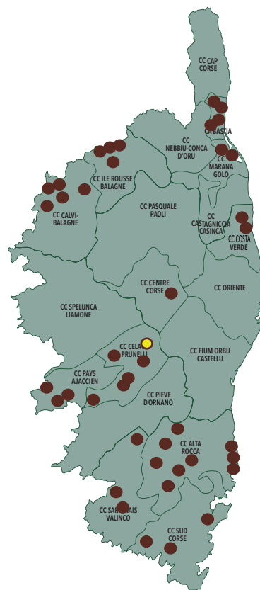
Carte des 41 composteurs partagés de Corse